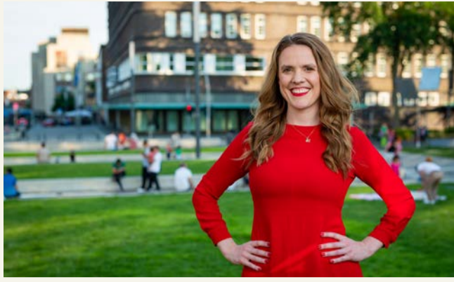
Terry Reintke: unsere Spitzenkandidatin für Europa