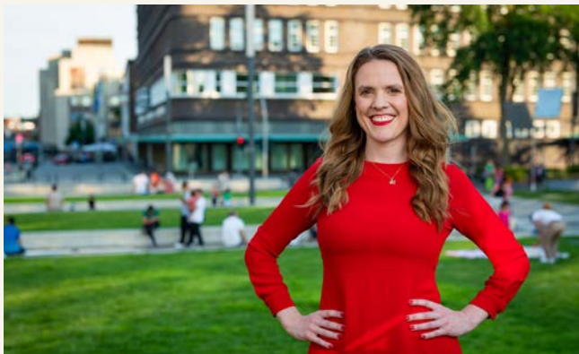
Terry Reintke: unsere Spitzenkandidatin für Europa